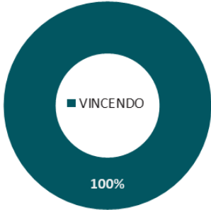
Histórico de Aquisição de Recebíveis